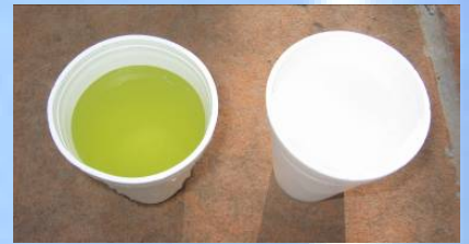
Agua de la Presa de Valsequillo, (Puebla, Méx.) antes y después del tratamiento