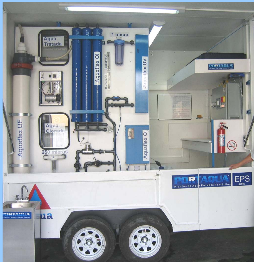
El remolque Portaqua EPS-FirstDrop produce 40,000 litros al día de agua purificada Controlado por el sistema AquaFlex® de Portaqua